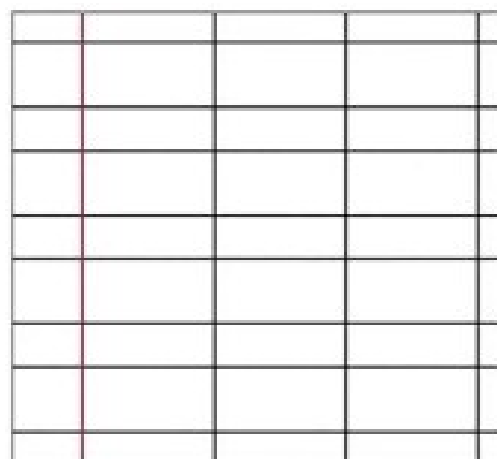
RIGHE A DI 1^ / 2^ elementare con margini